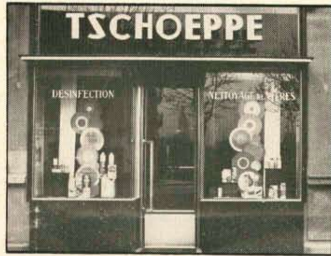
Notre siège 9, boulevard Wilson