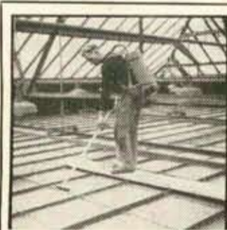
Epoussetage du plafond vitré à la Bourse du Commerce

ETS TSCHOEPPÉ & Cie 9, BOULEVARD WILSON à STRASBOURG