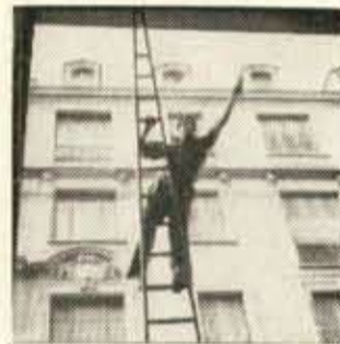
Laver une vitre de cette dimension est l'affaire d'un spécialiste